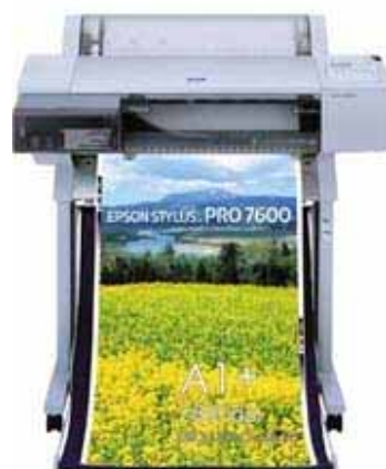
EPSON STYLUS PRO 7600 (A1+)

PRO 7600 是 PRO 9600 的姐妹型号，它采用了相同打印系统，能提供最高 2880DPI 精度的图像品质，最大幅宽 24”（A1+ 尺寸）。这个型号体积小，使高质量的彩色打印变得简单及经济效益更大。